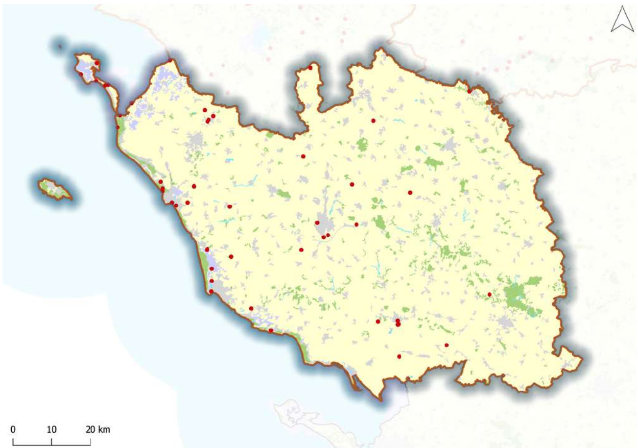
Carte des signalements reçus en 2022 en Vendée

Ce document présente le bilan du projet Sentinelles de la Nature en Vendée pour l'année 2022.